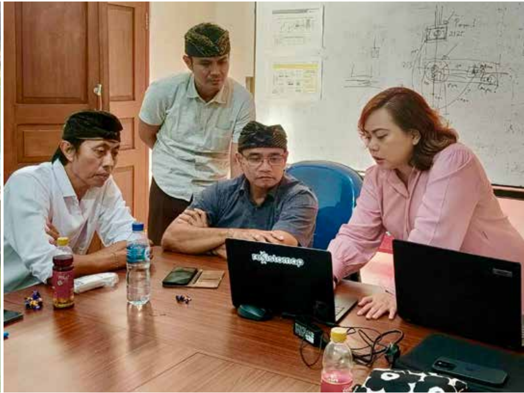
Bioteknologiayritys Resistomap Oy tarjoaa menetelmiä ympäristön antibioottiresistenssin seuraamiseen.

taviin liiketoiminnan kehitysprojekteihin, jotka eivät muutoin olisi välttämättä toteutuneet.